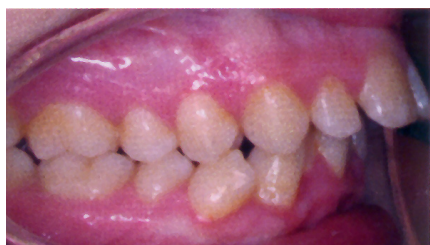
Vorbiss des Unterkiefers