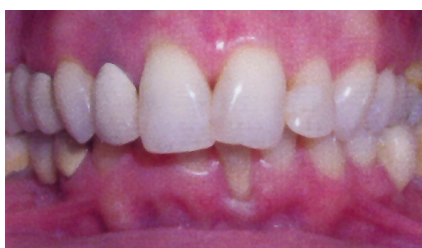
durch Zahnfleisch- entzündung bedingte Zahnwanderungen