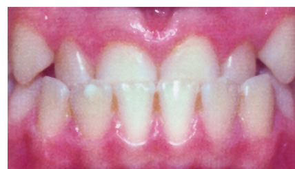
Kreuzbiss der Schneidezähne