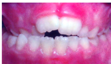
Kreuzbiss der Seitenzähne