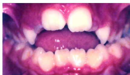
offener Biss (meist durch Lutschen verursacht)