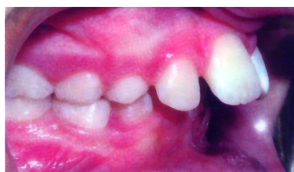
Vorbiss des Oberkiefers