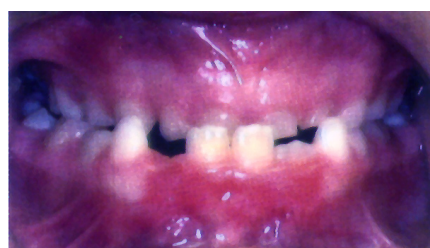
schwerer Vorbiss des Unterkiefers