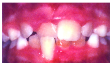
Kreuzbiss der Schneidezähne

Wir empfehlen eine frühzeitige Vorstellung beim Fachzahnarzt für Kieferorthopädie – spätestens bis zum 7. Lebensjahr